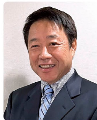
早稲田大学教育・総合科学学術院 教育心理学専修